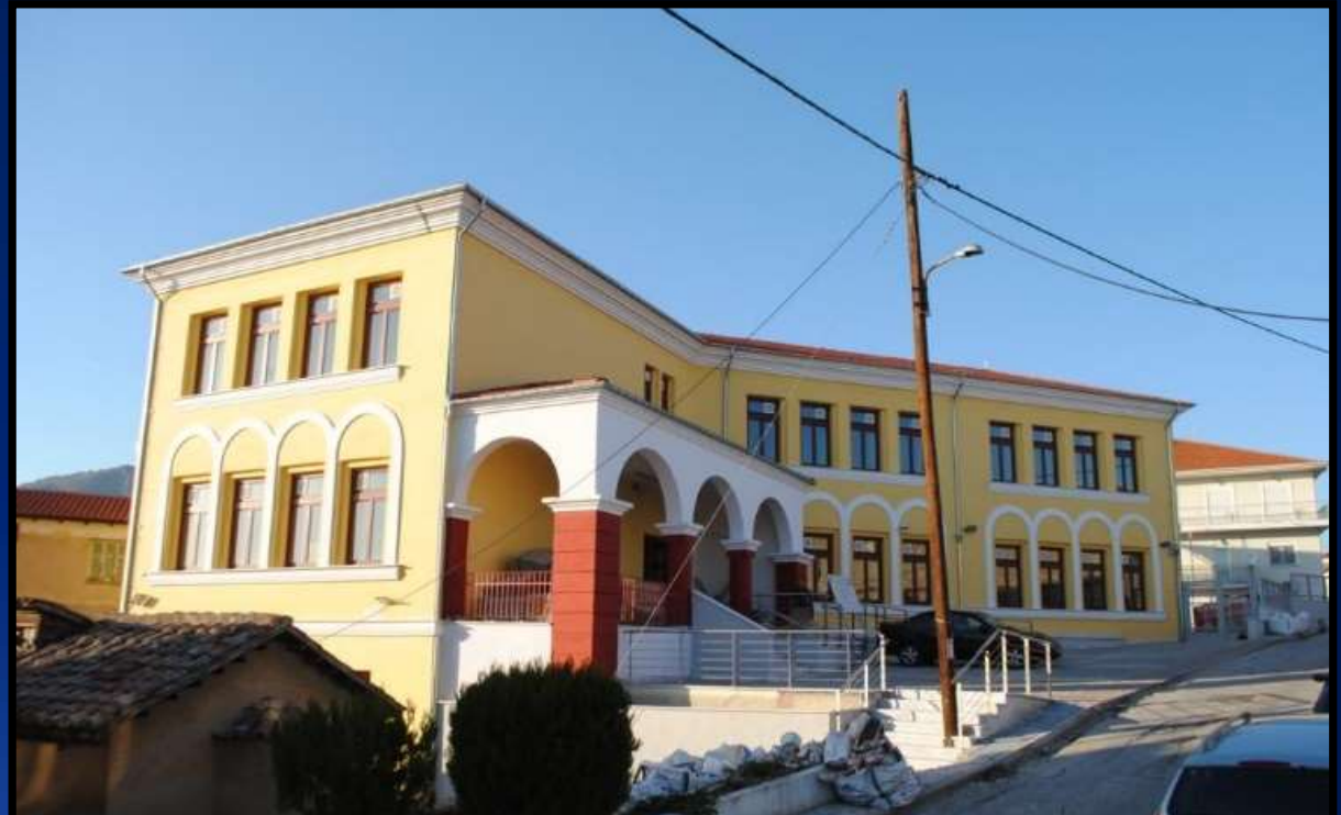
Αποκατάσταση κτιρίου 1ου 8ου Δημοτικού Σχολείου Καστοριάς