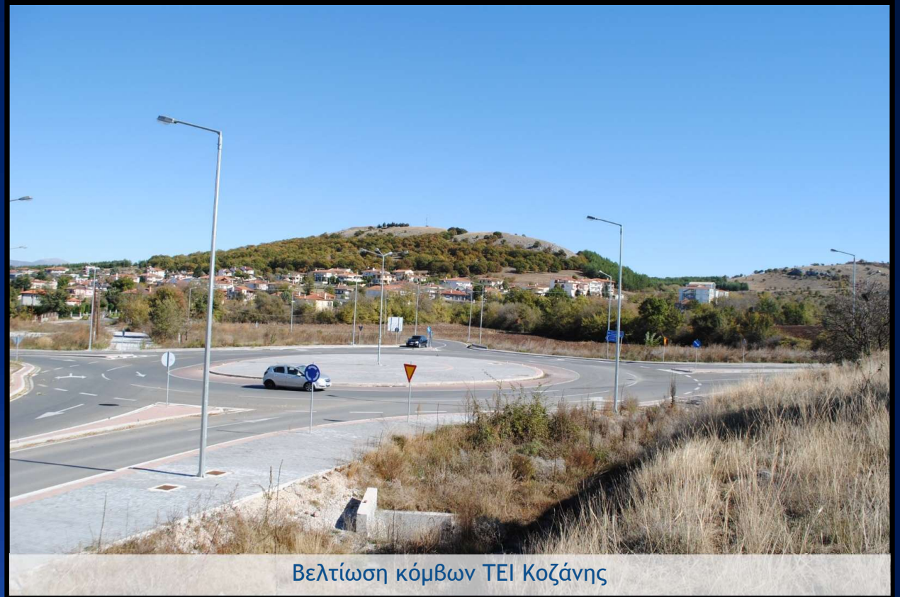
Βελτίωση κόμβων ΤΕΙ Κοζάνης