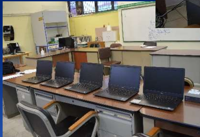
Εξοπλισμός ΤΠΕ Σχολικών Μονάδων Δυτικής Μακεδονίας