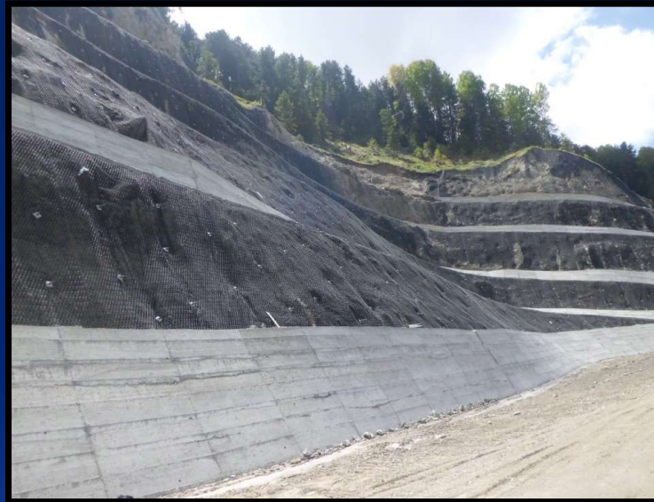
Αποκατάσταση οδού Βελβεντό - Καταφύγι